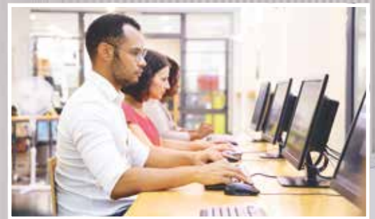
E-Wel, Projet d'inclusion numérique

Vers la rénovation du complexe sportif de Henri-Chapelle