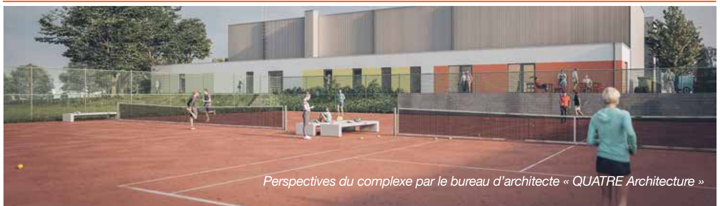
Perspectives du complexe par le bureau d'architecte « QUATRE Architecture »